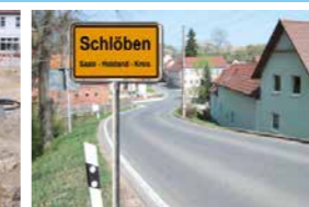
Nahwärmenetze gesamte Ortschaft